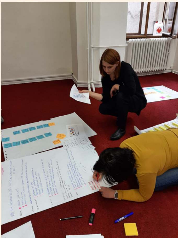
Při práci na workshopu

Jsem milovnice nejen knížek, ale obecně i všech textů :-). S tím souvisí i to, že se mi těžko vybírá nejoblíbenější knížka. V poslední době se mi moc líbila knížka Tajemství oblázkové hory, kterou jsme četly s dcerou. Je to knížka, kde kromě napínavého příběhu pro děti, můžeme najít na mnoha rovinách témata, která se váží k rozvoji člověka jako osobnosti, k širšímu kontextu dospívání, genderové problematice i vlivu sociálního prostředí na mladé lidi.